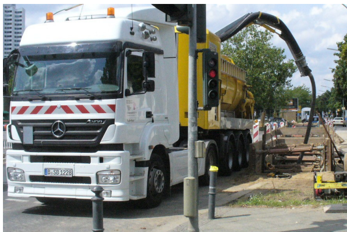
Flexloader mit Sattelzugmaschine (SZM)