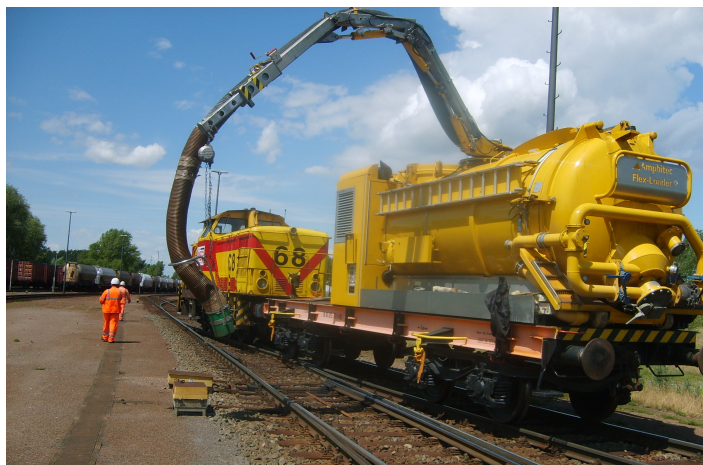
Flexloader auf Bahnwaggon